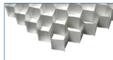
Alveolare in alluminio