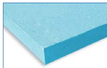
Schiuma di polistirene