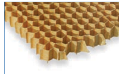
Alveolare in carta aramidica - Nomex